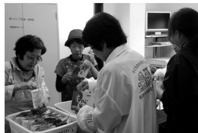
↑非常食であるレトルトの五目ごはんの試食もありました

初期消火の対策として、「水で濡らして、硬くしぼったタオルが有効である」ともいわれています。燃えるには空気が必要で、その空気を遮断するという意味でタオルをかけ、またそのタオルが乾いていたら燃えてしまうので、水にぬらしたタオルを使うということです。くれぐれもタオルは硬く絞ること!(油に水滴がつくと燃え上がります)